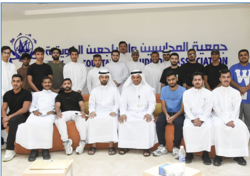
"المحاسبين" نظمت تدريب ميداني لطلبة "الدراسات التجارية"