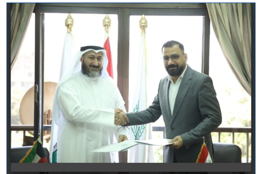
توقيع بروتوكول تعاون مع "المحاسبين العرب"