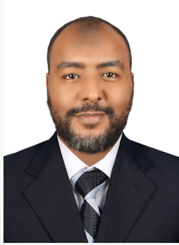
إعداد الباحث إسلام صديق