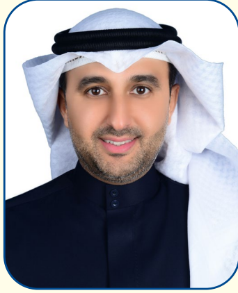
إعداد الباحث ناصر محمد سليمان الغانم