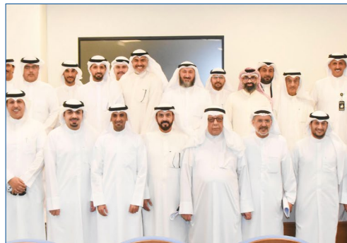
"المحاسبين" عقدت عموميتها وأقرت كافة البنود